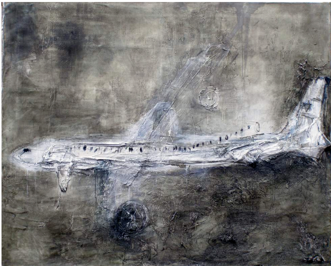
ללא כותרת, 2007, טכניקה מעורבת על בד, 180X160 Untitled, 2007, mixed media on canvas, 160x180