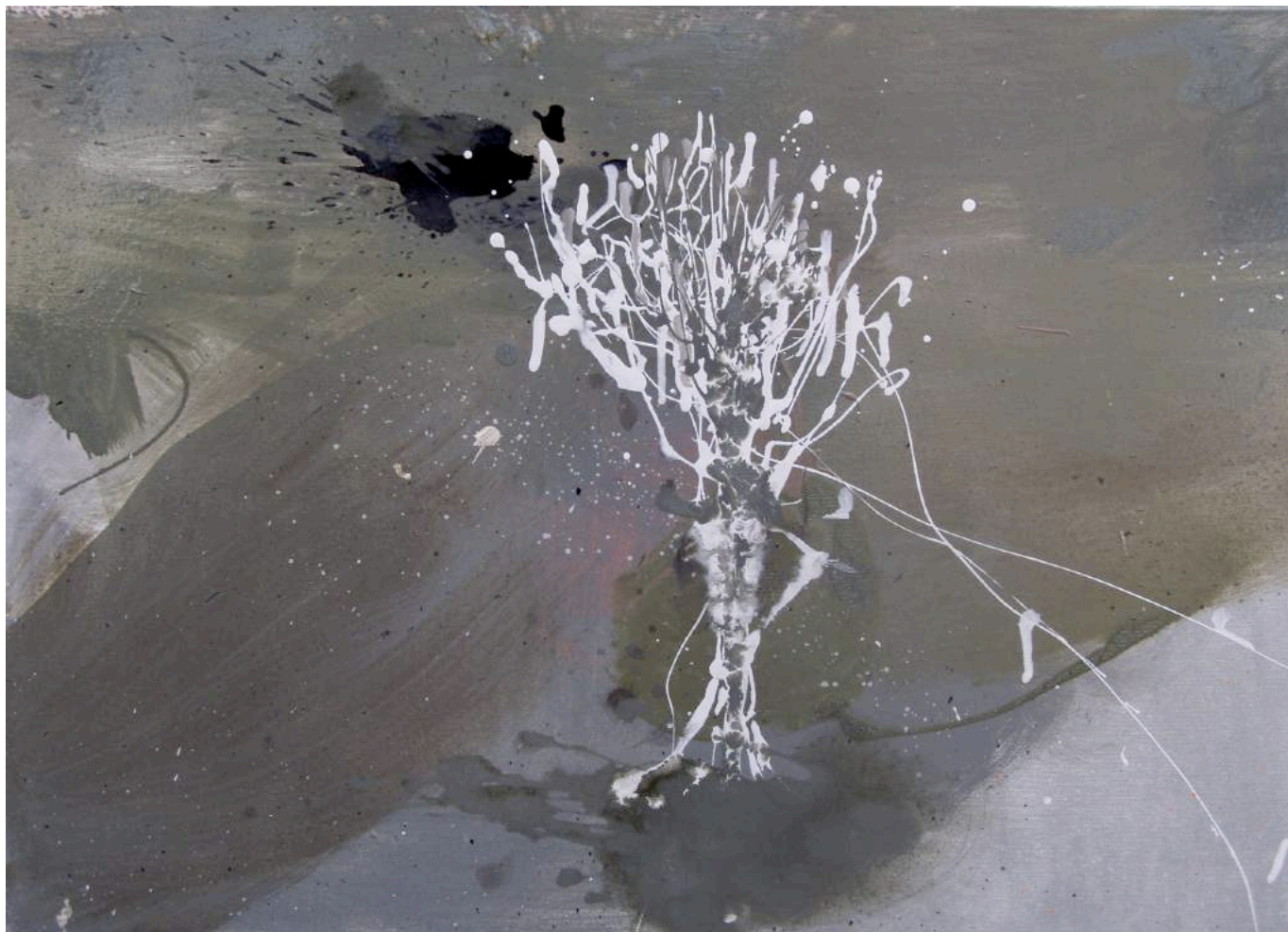
עץ, 2009, אקריליק וצבע תעשייתי על בד, 70X50 Tree , 2009, acrylic and industrial paint on canvas, 50x70