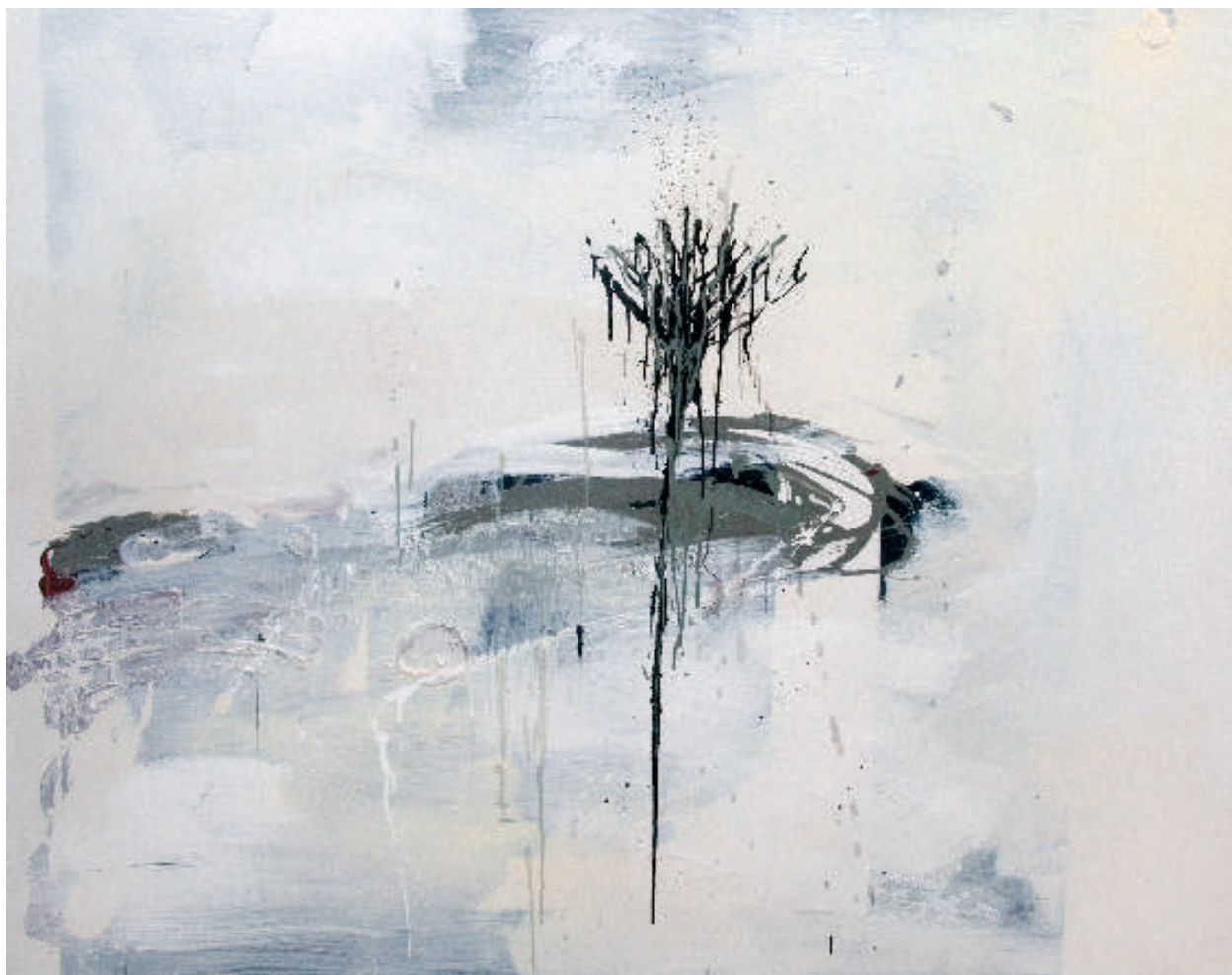
עץ, 2009, אקריליק וצבע תעשייתי על בד, 150X120 Tree , 2009, acrylic and industrial paint on canvas, 120x150