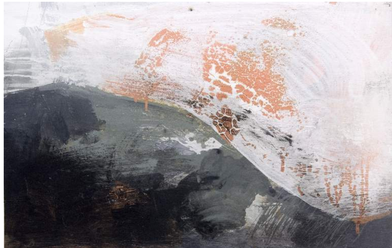
נוף, 2009, אקריליק וצבע תעשייתי על בד, 70X50 View, 2009, acrylic and industrial paint on canvas, 50x70