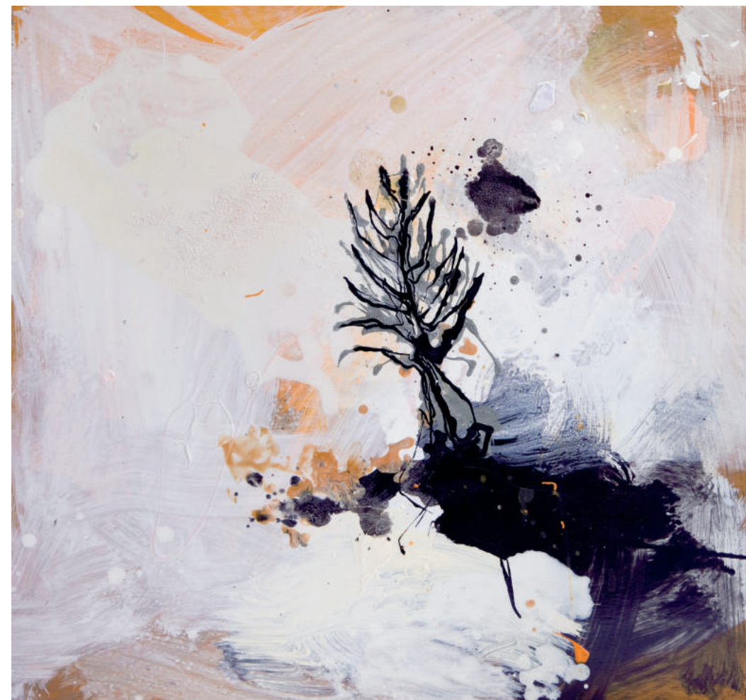
עץ, 2009, אקריליק וצבע תעשייתי על עץ, 58X54 Tree , 2009, acrylic and industrial paint on wood, 54x58