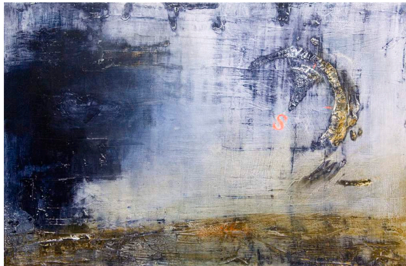
מתוך הסדרה "ארבעה אובייקטים בלילה", צפון, 2008, טכניקה מעורבת על בד, 60X40 From the series "4 Objects at Night," North , 2008, mixed media on canvas, 40x60