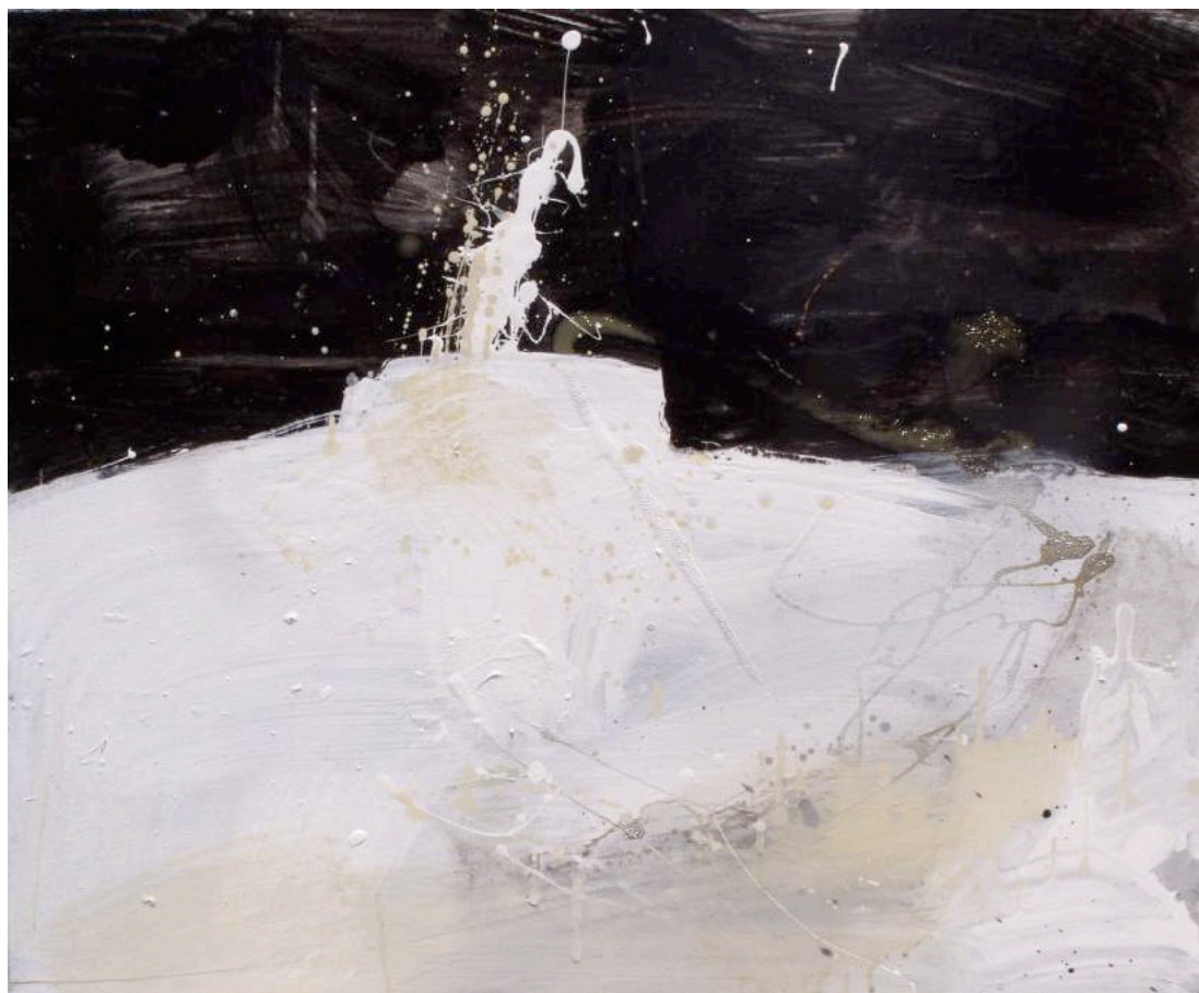
נוף, 2009, אקריליק וצבע תעשייתי על בד, 65X54 View, 2009, acrylic and industrial paint on canvas, 54x65

<< נוף (דיפטיך), 2009, אקריליק וצבע תעשייתי על בד, 260X150