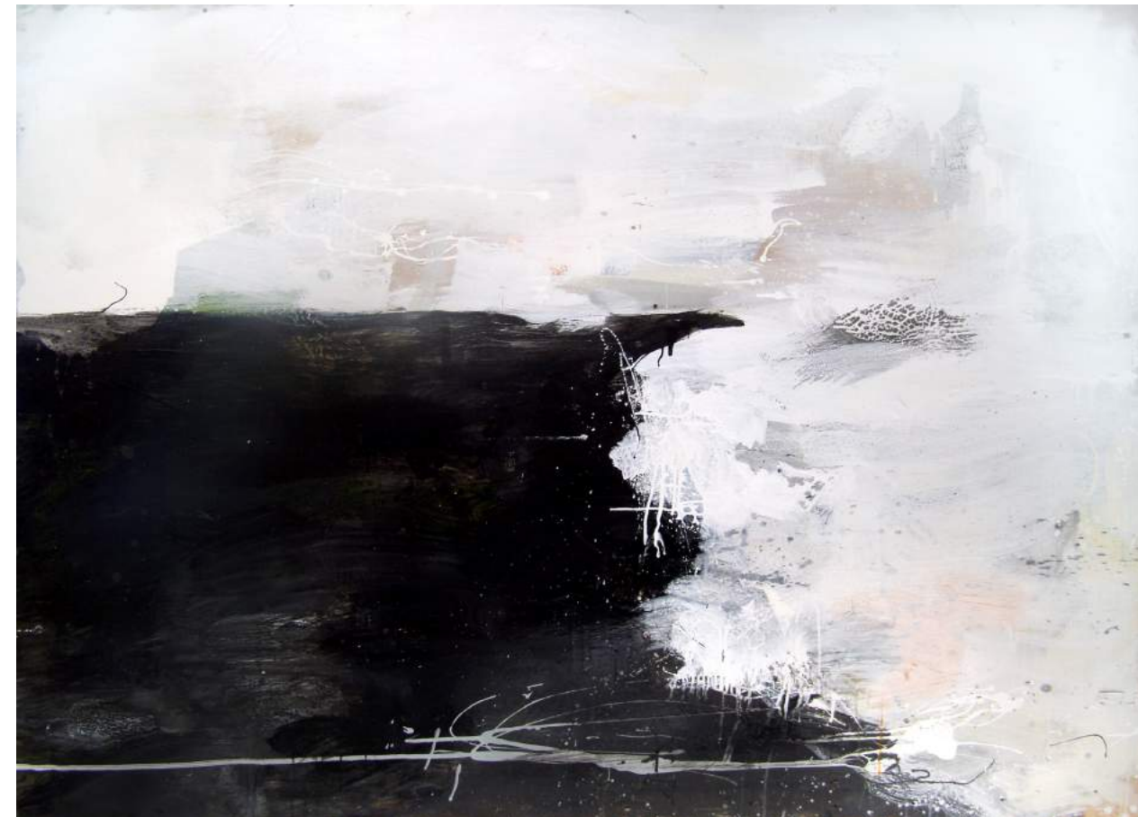
ים, 2009, אקריליק וצבע תעשייתי על עץ, 169X122 Sea, 2009, acrylic and industrial paint on wood, 122x169

<< נוף (דיפטיך), 2009, אקריליק וצבע תעשייתי על בד, 260X150