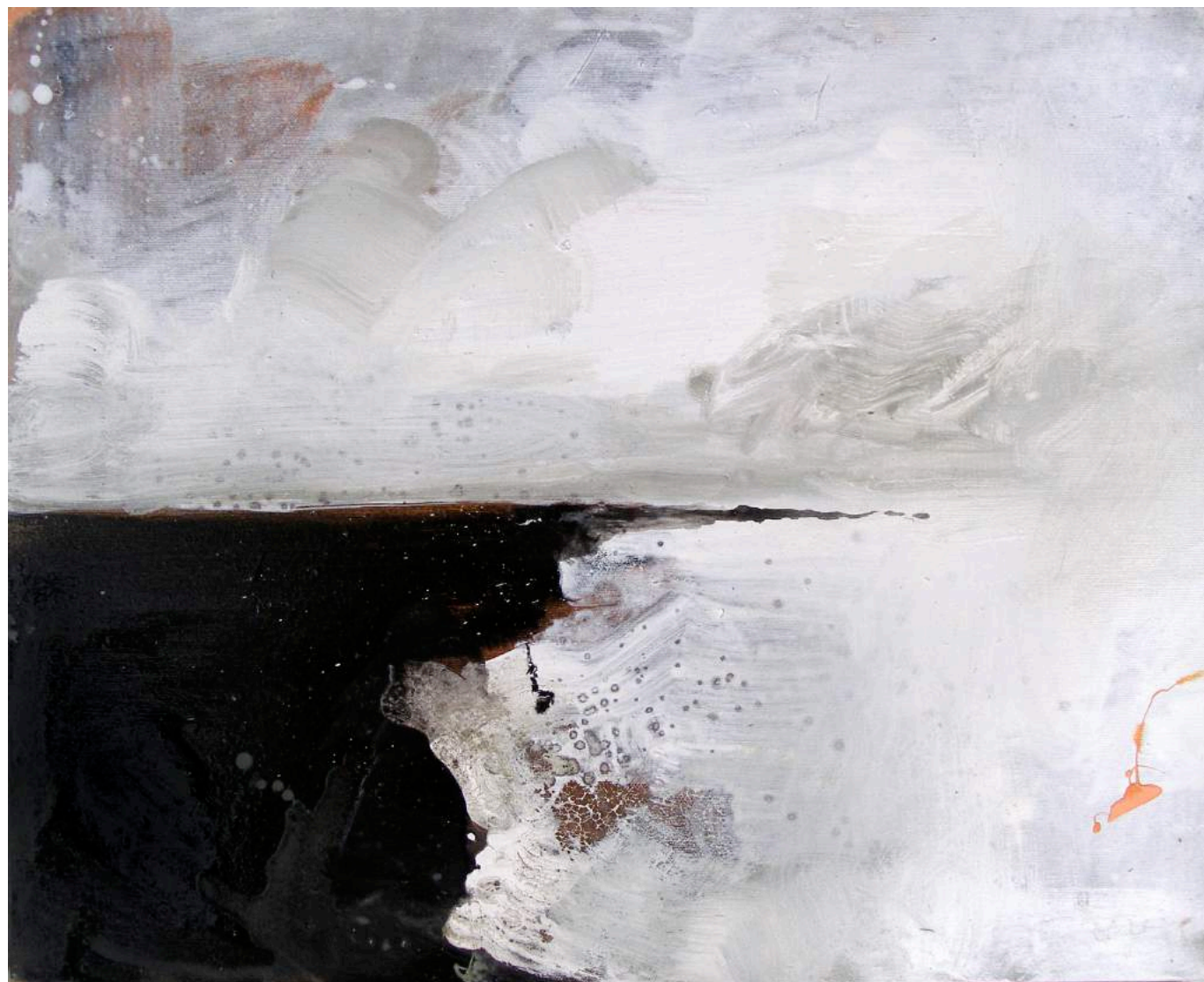
י, 2009, אקריליק וצבע תעשייתי על בד, 56X46 Sea, 2009, acrylic and industrial paint on canvas, 46x56