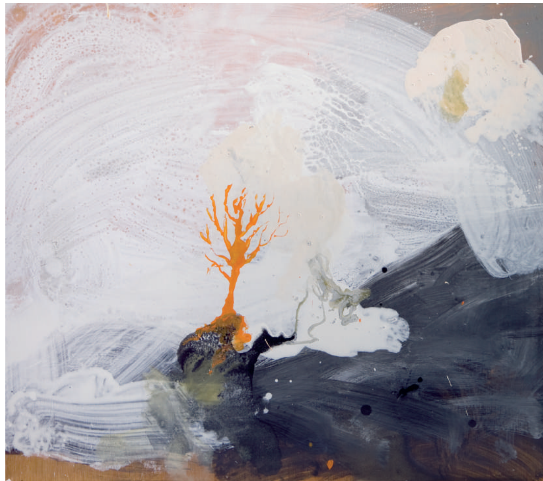
עץ, 2009, אקריליק וצבע תעשייתי על עץ, 54X48 Tree , 2009, acrylic and industrial paint on wood, 48x54