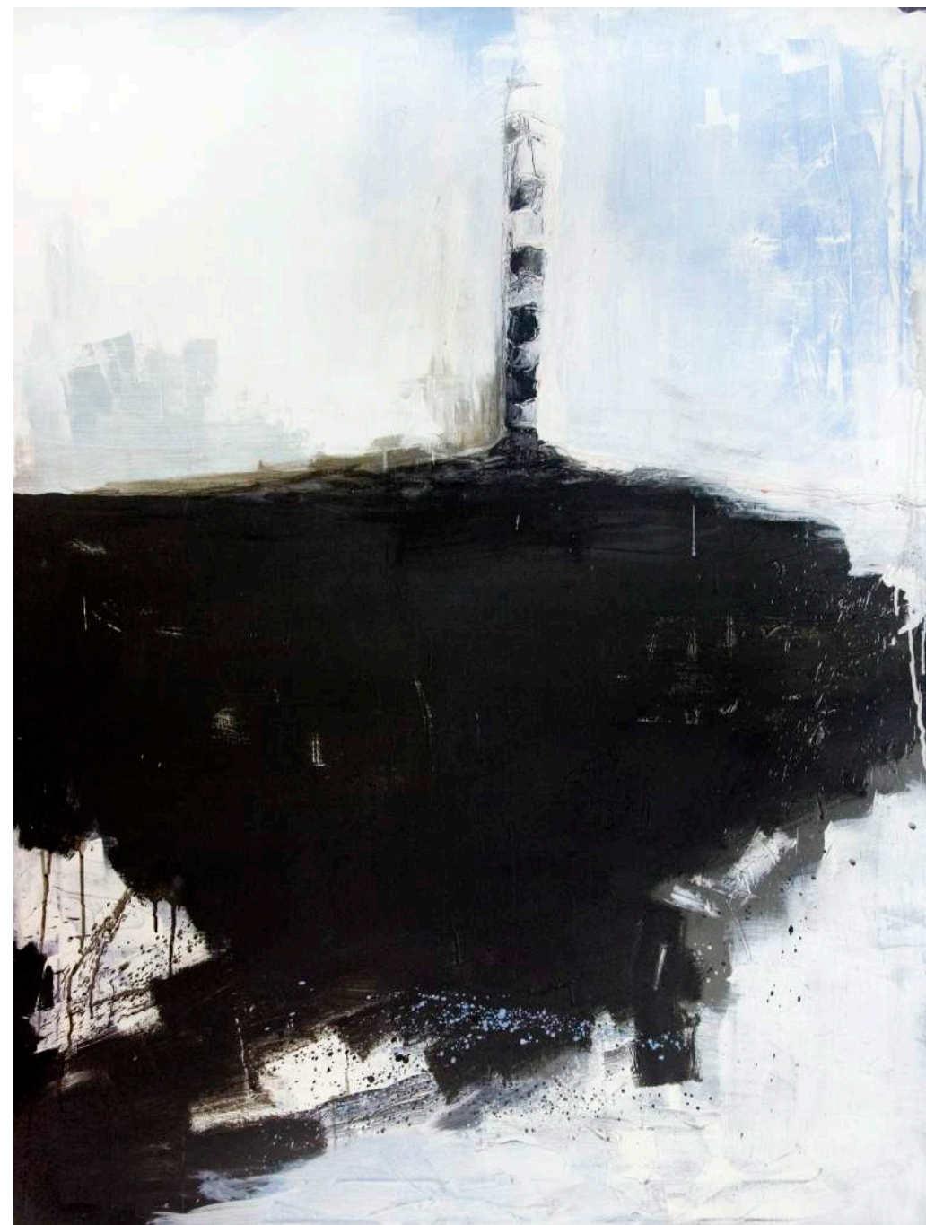
ללא כותרת, 2007, אקריליק וסיליקון על בד, 90X120 Untitled, 2007, acrylic and silicone on canvas, 120x90