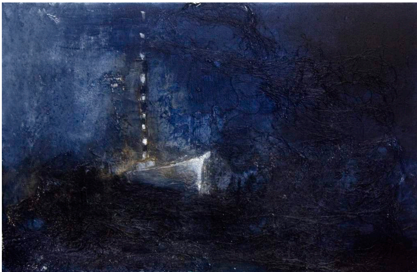
מתוך הסדרה "ארבעה אובייקטים בלילה", אניה, 2008, טכניקה מעורבת על בד, 60X40 From the series "4 Objects at Night," Boat , 2008, mixed media on canvas, 40x60