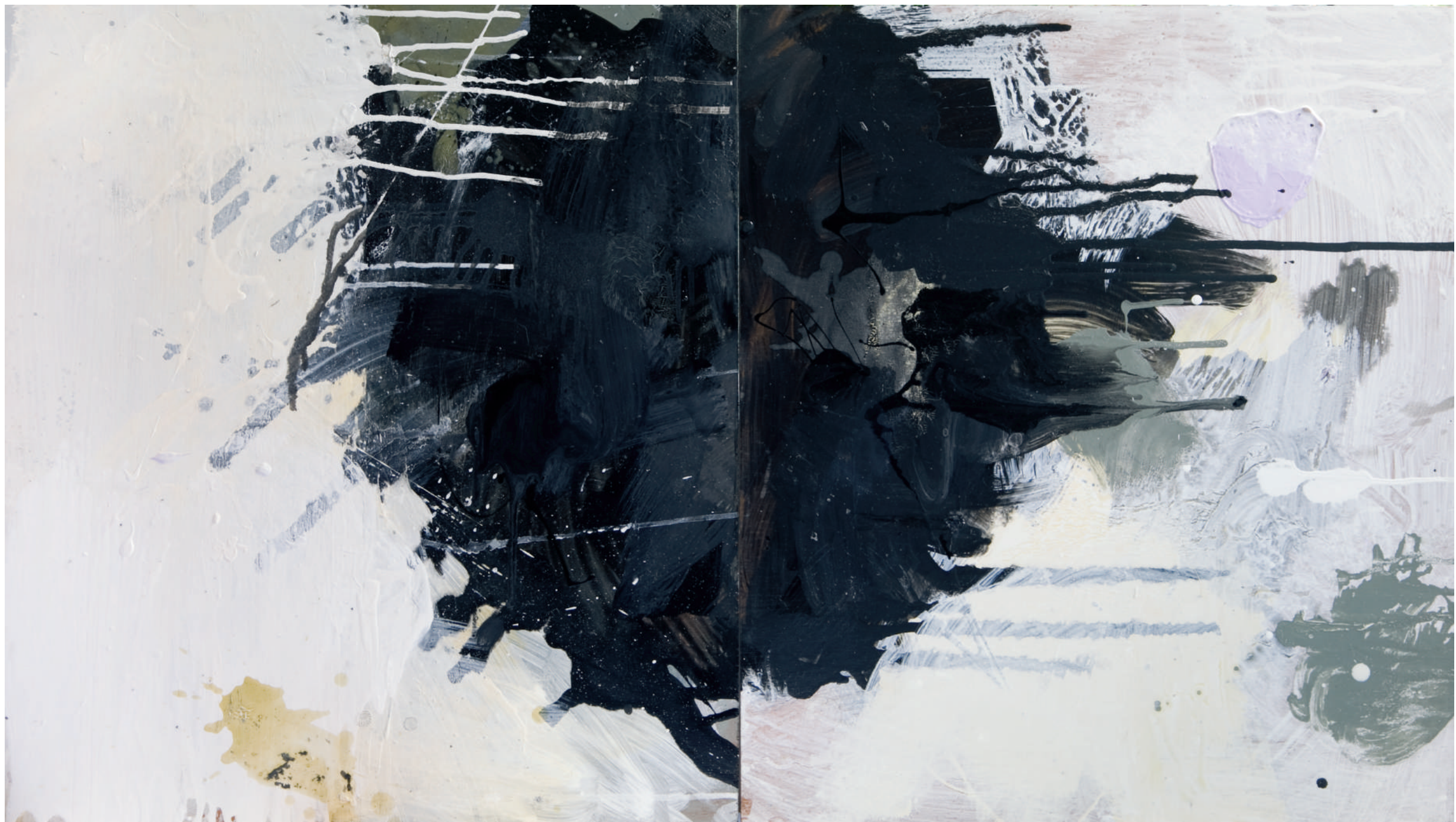
Untitled (diptych), 2009, acrylic and industrial paint on wood, 54x95