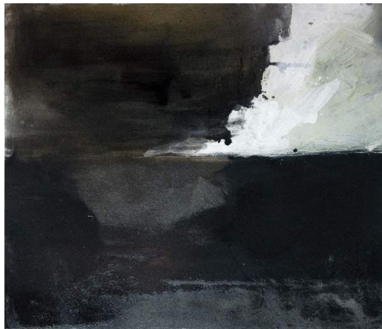
ללא כותרת, 2009, אקריליק וצבע תעשייתי על בד, 97X82 Untitled, 2009, acrylic and industrial paint on canvas, 82x97