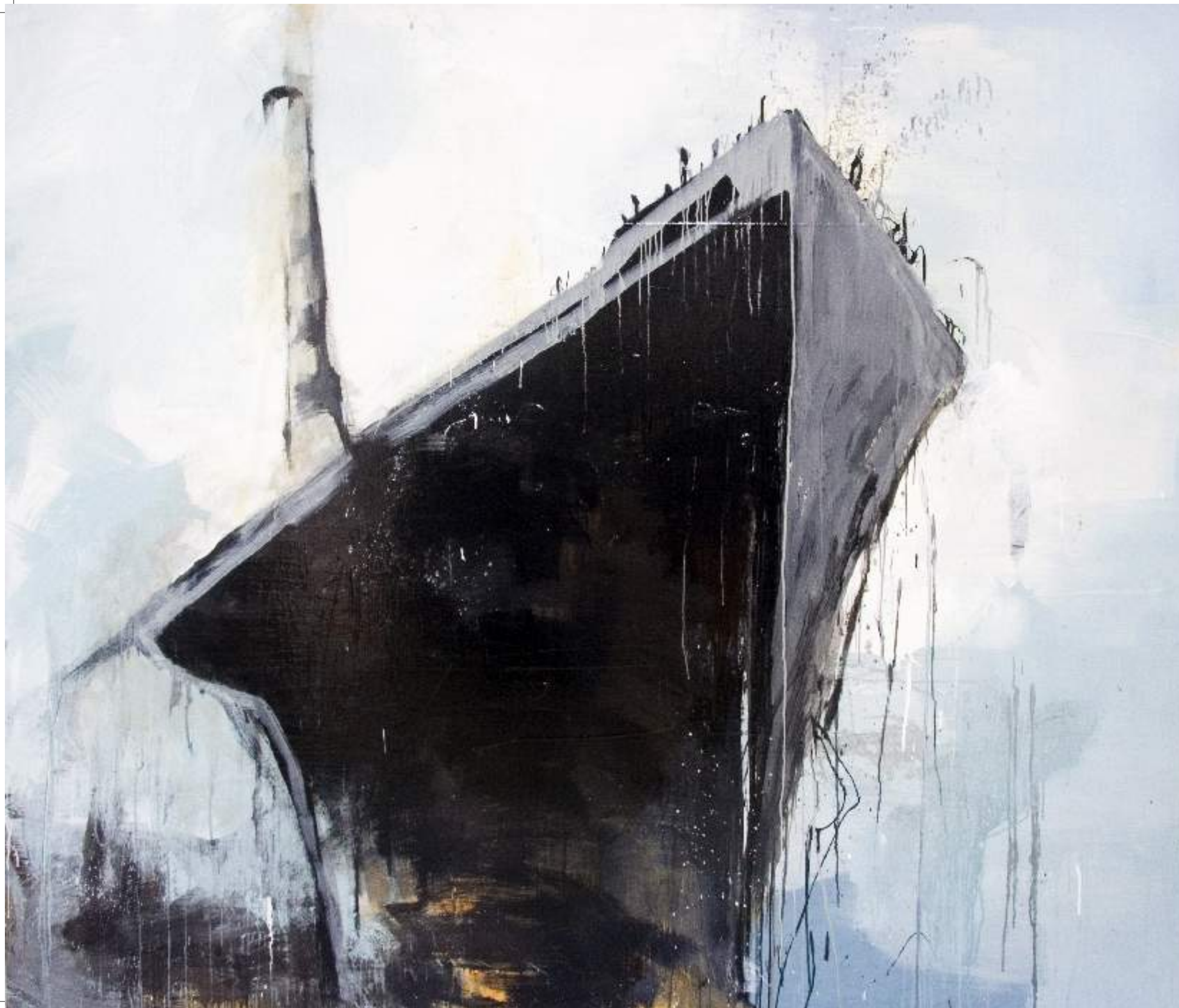
בית, 2009, אקריליק וצבע תעשייתי על בד, 200X180 Home , 2009, acrylic and industrial paint on canvas, 180x200