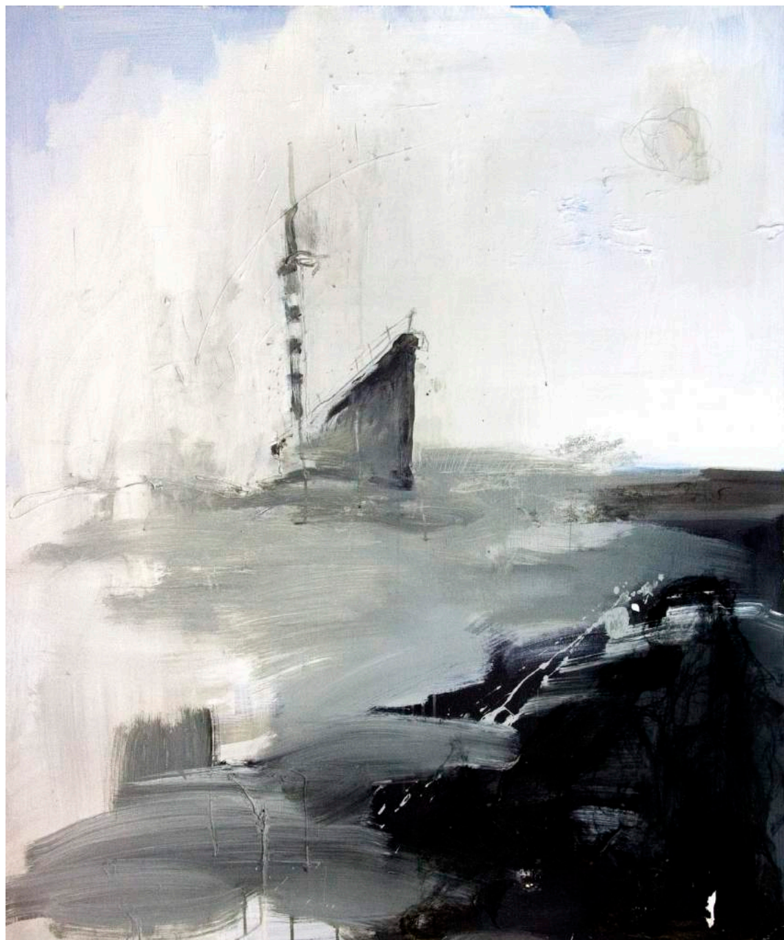
ללא כותרת, 2007, אקריליק, גרפיט וסיליקון על בד, 90X100 Untitled, 2007, acrylic, graphite and silicone on canvas, 100x90